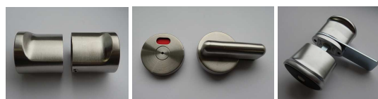
kulička provedení nerez západka provedení nerez kulička se západkou - chrom