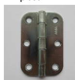
pant provedení standard