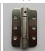
pant provedení nerez